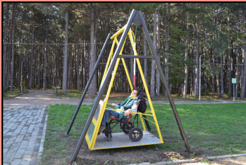
Parku Liria, Ferizaj

Loja, konsiderohet një nga të drejtat themelore të çdo fëmije. Përmes saj, fëmijët mësojnë rreth botës, vetes, bashkëveprojnë me të tjerët, duke zhvilluar kështu aftësitë sociale dhe motorike. Ndaj, këndi i lojërave është një hapësirë e rëndësishme e cila kontribuon në zhvillimin e fëmijëve dhe si i tillë, do duhej të ishte i qasshëm për të gjithë fëmijët.