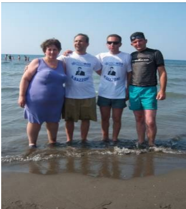
Pjesmarrës nga Shoqata e të Verbërve