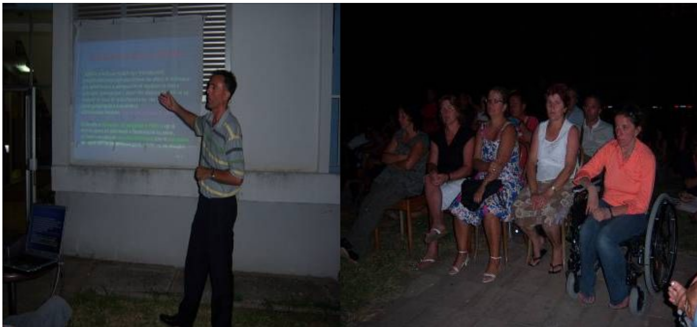
Pjesmarrës duke ndjekur Temen "Aftësia e kufizuar si qështje e të drejtave të njeriut"

Është më rëndësi të theksohet se interesimi i pjesmarrësve ka qenë shumë i lartë dhe pjesmarrja e tyre ka qenë shumë aktive.