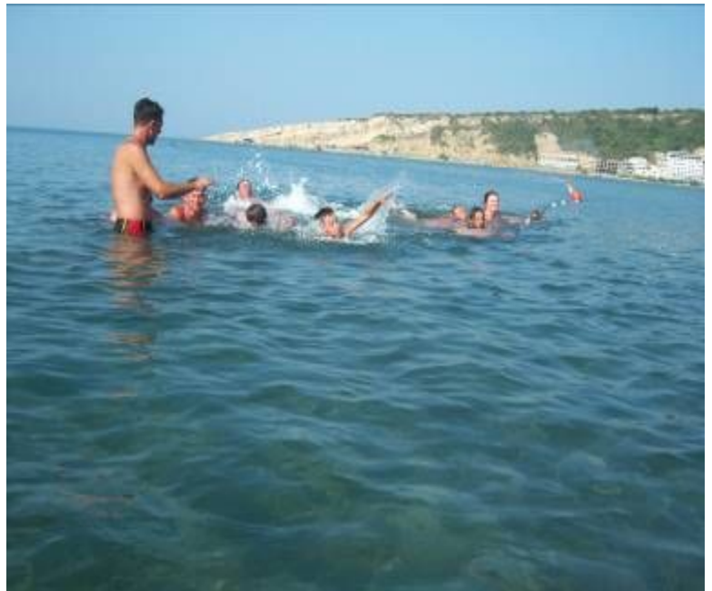
Të mësuarit e notit për ata që deri më tani nuk kanë ditë të notojnë

Duke ditur se një numër i madhë i pjesmarrësve janë ballafaquar për herë të parë me ujin e detit dhe nuk kanë pasur njohuri mbi notin, është aplikuar sistemi i futjes në ujë me percjelles dhe janë demonstruar njohuri themelore të mësimit të notimit. Gjithashtu për qdo ditë është aplikuar edhe futja në ujë të personave që nuk kanë mundur të lëvizin dhe u është mundësuar assistim i deshiruar në ujë nga stafi i grupit dhe pjesmarrësve tjerë vullnetar