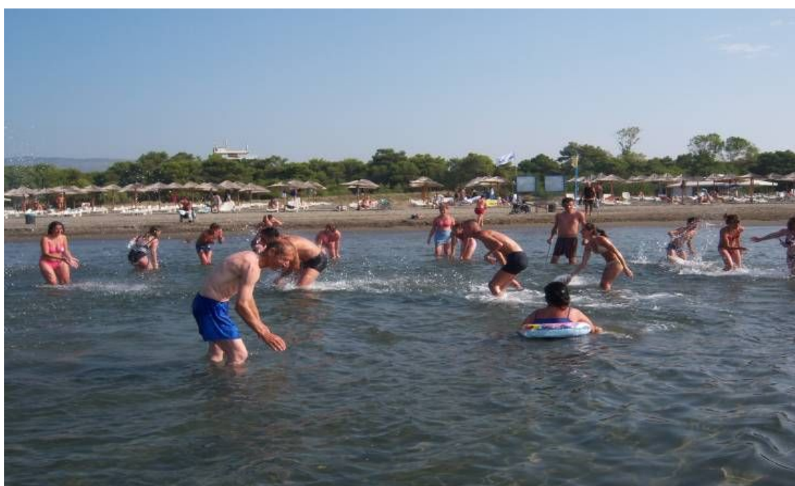
Loja e perbashket të gjithë në ujë

Vlenë të theksohet se gjatë gjithë kohës, të gjithë pjesmarrësit, në menyrë të organizuar dhe masovikisht kanë qenë pjesë përbërëse e të gjitha aktiviteteve sportive dhe kulturore që janë organizuar në kamp.