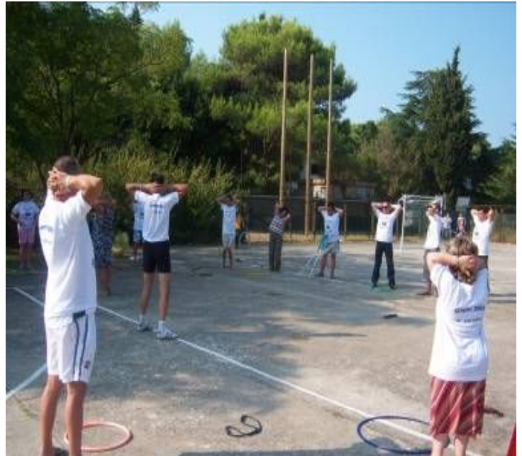
Gjymnastika e mengjesit e zhvilluar në fushën e sportive pranë Hotelit Belevi

Një pjesë e aktiviteteve fizikale të gjymnastikës së mengjesit janë zhvilluar në fushën sportive pranë hotelit, ndërsa një pjesë tjetër në plazhin buzë detit.