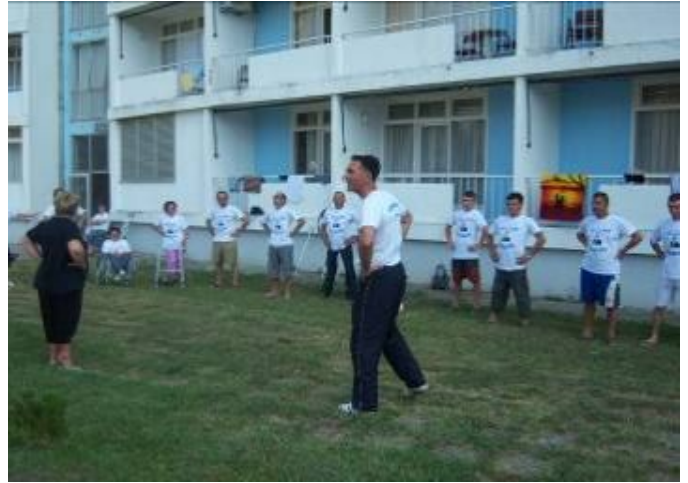
Gjymnastika e mengjesit ,dita e parë (njohja me njeri tjetrin) dhe meditimi

Pjesë e rëndësishme e planit të aktiviteteve është avansimi dhe mirmbajtja e gjendjes fizike të pjesmarrësve. Gjymnastika e mengjesit e cila është aplikuar për qdo mengjes, është zbërthyer në vete me aktivitetet të llojllojshme fizike, si: (nxemja e muskujve të gjymtyrëve të epërme dhe të poshtme të trupit, stimulimi i muskujve të gjymtyrëve, lëvizjet e nyjeve të gishtave të dorës, brrylave të duarvë dhe të këmbëve, nyjeve të qafës, belit dhe pjesëve tjera të trupit.