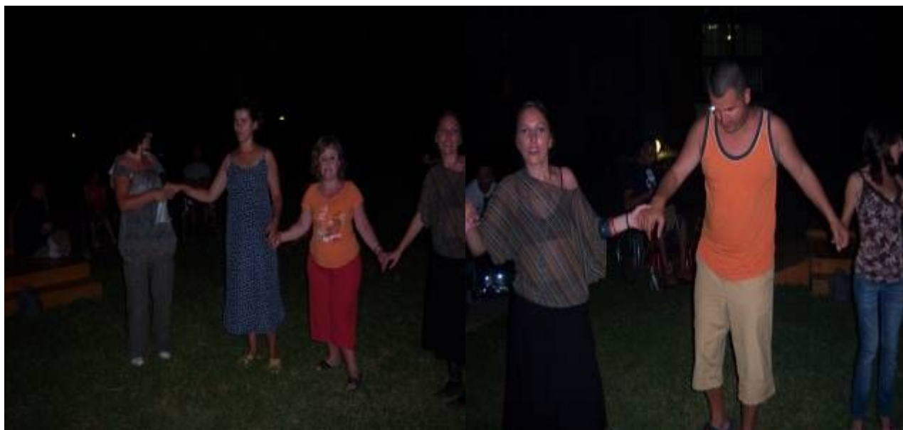
Të gjithë në vallë pa dallim