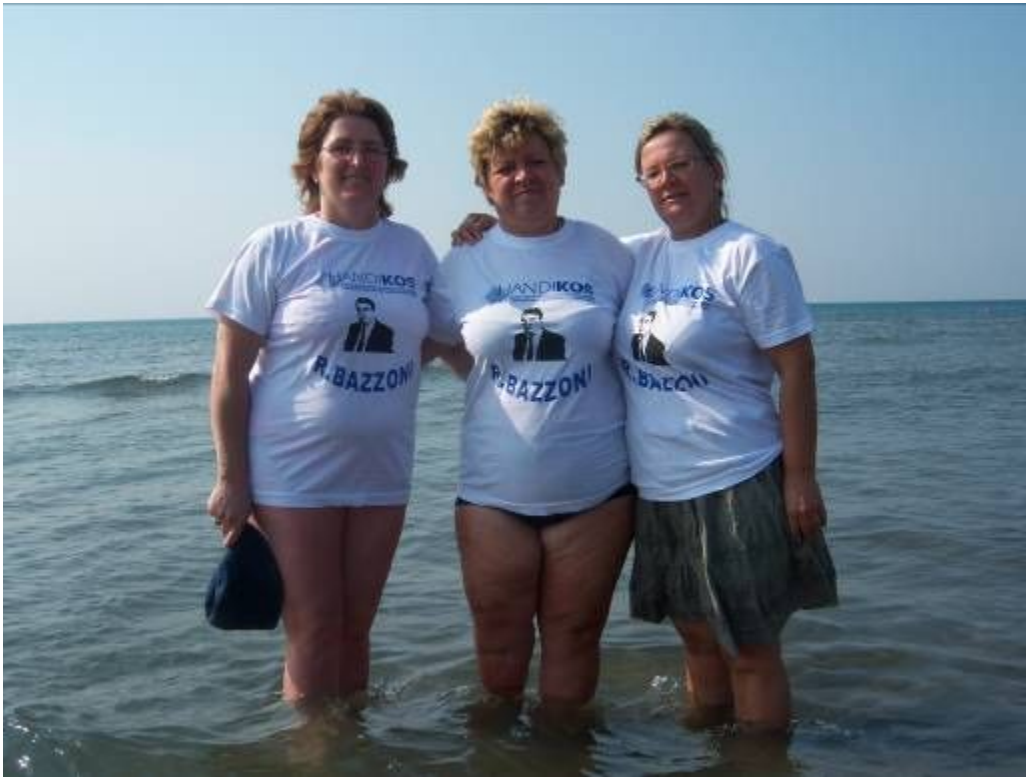
Pjesmarrës nga Shoqata e të Shurdhërve e Kosovës