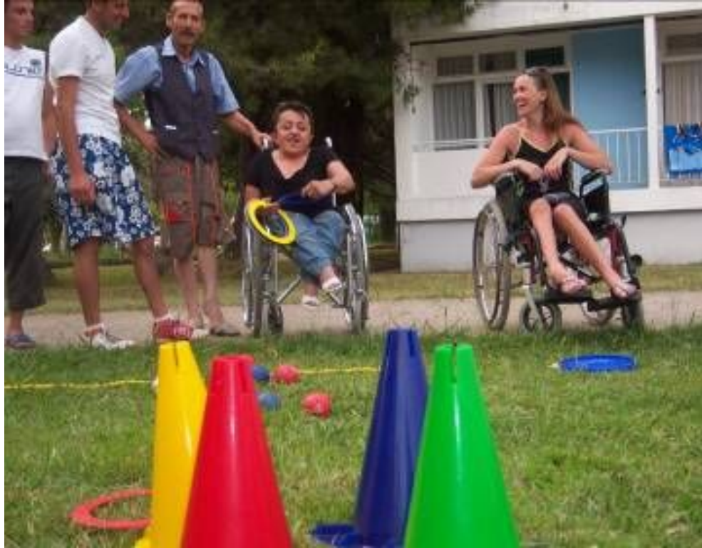
Zhvillimi i garave ne hudhjen e rathëve dhe topave në bar