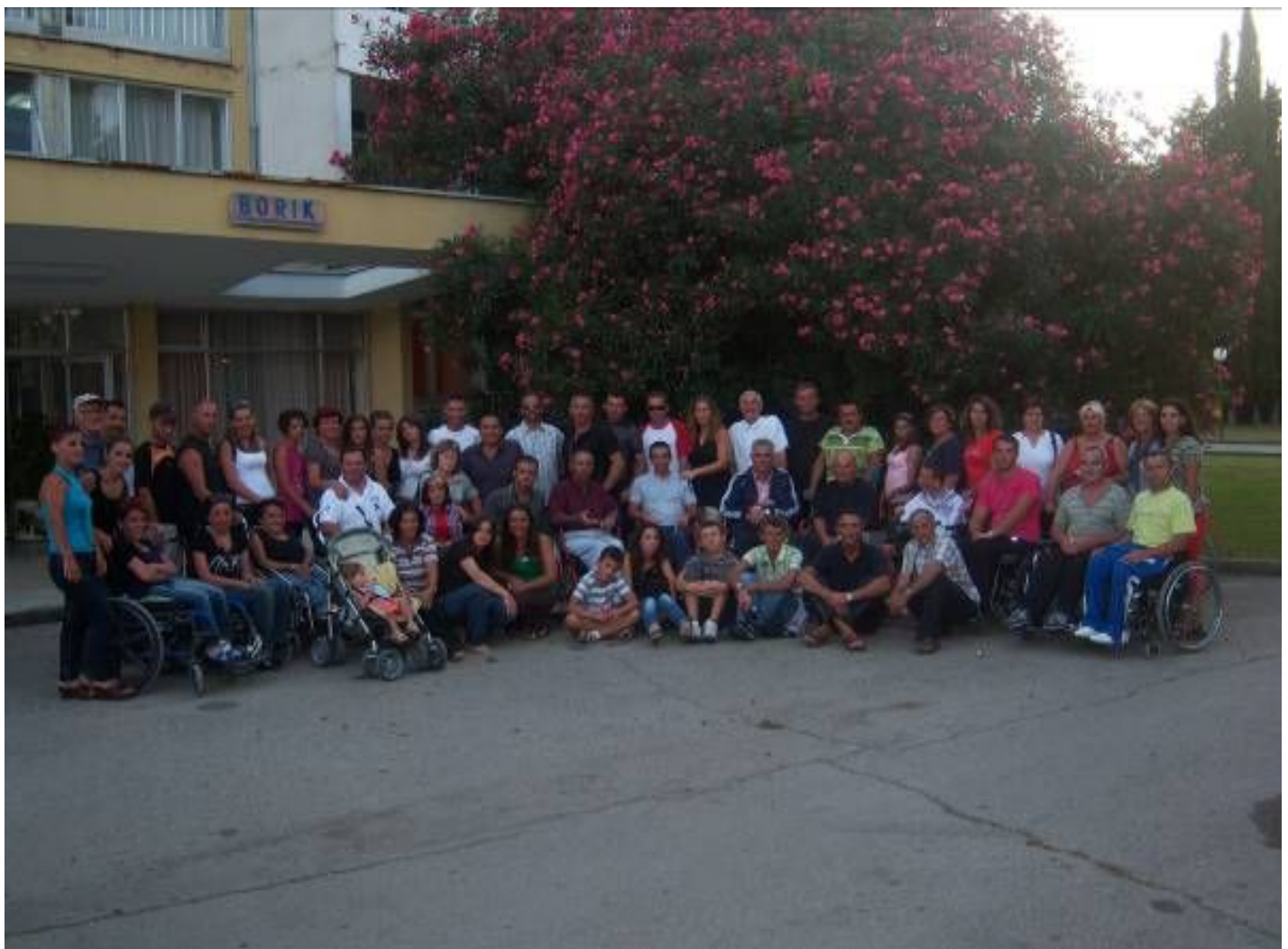
Foto e perbashkët e pjesmarrësve të të dy grupeve (Grupit II dhe III)