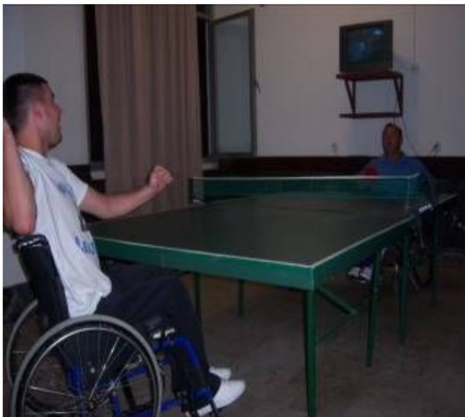
Garat ne pingpongut

Për qdo ditë e sidomos në orët e pasditës janë aplikuar aktivitete sportive – rekreative si psh :zhvillimi i garave në disiplinën e ping – pongut atë në pikado,si dhe aktivitetet tjera kulturore muzikore.