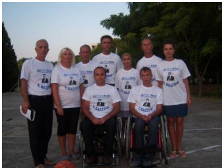
Stafi o kampit

Bazuar në atë se kësaj here të dy grupet(grupi i dytë dhe ai i tretë)kanë marrë pjesë në kamp në të njëjtën kohë,kordinimi dhe bashkëpunimi i stafeve të të dy grupeve ka qenë i përbashkët dhe në përgjithësi menagjimi i të dy grupeve ka qenë i udhëhequr nga një qendër komanduese,përfshirë disa aktivitetet të cilat për shkak të rrethanave objektive janë zhvilluar ndaras.