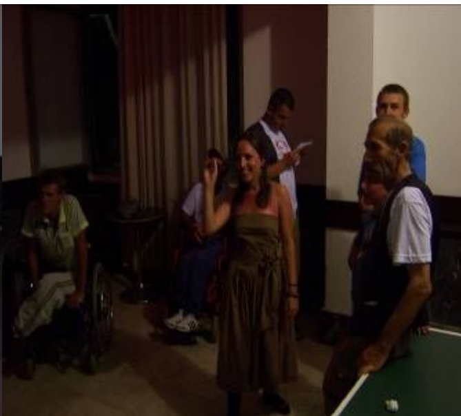
Ggarave ne pikado