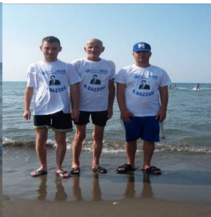
Pjesmarrës nga Klubi "Dëshira" të Kosovës