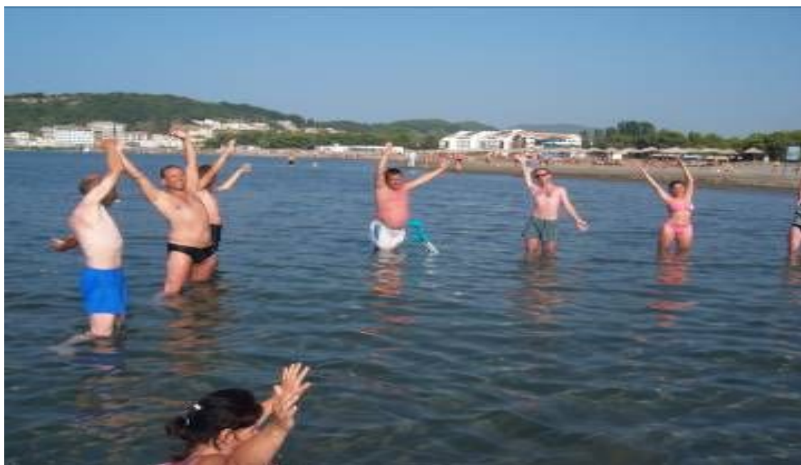
Aktivitetet i perbashket i zhvilluar ne ujë