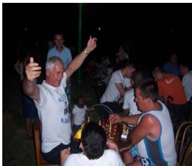
Me i miri ne Turnirin e Sgahut