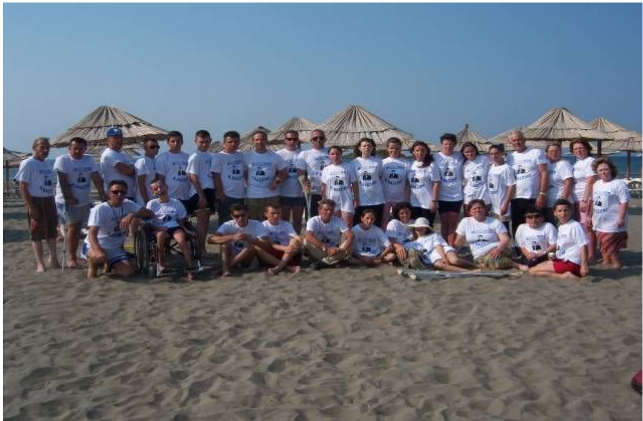
Foto e pjesmarrësve në kamp nga grupi i tretë